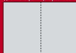
двойна страница с разгъване

Готови карета: EPS файл - ASCII, без Bleed Area. PDF файл - Резолюция 2540 dpi. Компресия на снимките JPEG Maximum Quality. Компресия на щриховите елементи (bitmap) ZIP/LZW. Да не се използва опция „Subset“ за шрифтовете.